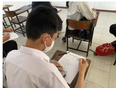
ภาพที่ 1 การฝึกการฟังภาษาอังกฤษโดยการใช้เพลง กิจกรรมฟังคำศัพท์ที่ขาดหายไป Listen to the missing words

จากภาพที่ 1 นักเรียนทำกิจกรรมฟังคำศัพท์ที่ขาดหายไป Listen to the missing words เพื่อฝึกความสามารถทางการฟังภาษาอังกฤษ พบว่า นักเรียนสามารถฟังและเติมคำศัพท์ที่ถูกต้องและแม่นยำ ผลคะแนนเฉลี่ยการทดสอบความสามารถทางการฟังภาษาอังกฤษมากกว่าร้อยละ 80 ของคะแนนเต็ม และมีนักเรียนผ่านเกณฑ์ที่กำหนดร้อยละ 80 ขึ้นไปตามที่กำหนด